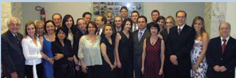
Diretoria da gestão 2009/2012